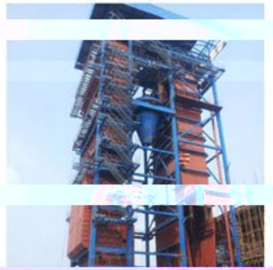
150吨流化床电站锅炉安装现场照片